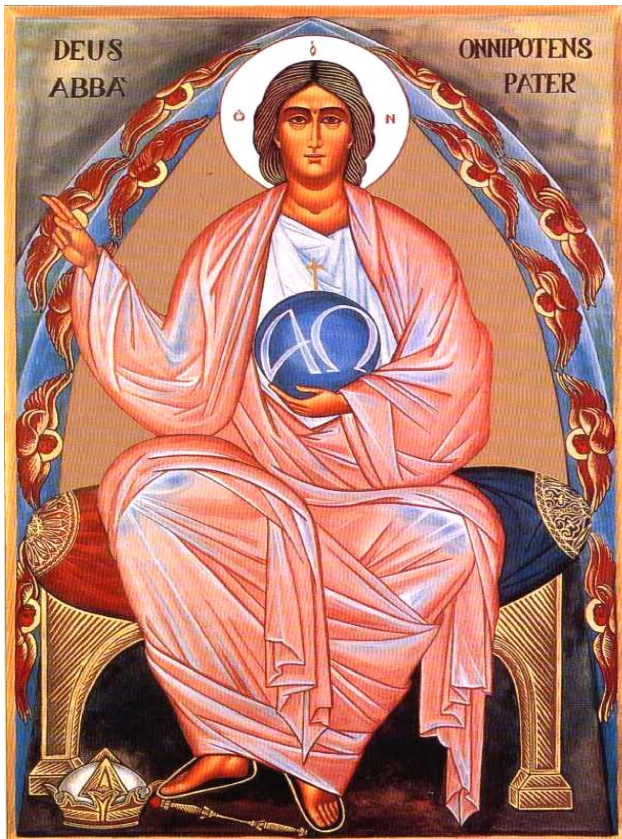
PRAWDZIWI OBRAZ BOGA OJCA Z OBJAWIENIA STWÓRCY W ORĘDZIU BOGA DANYM - SIOSTRZE EUGENII ELISABETT RAVASIO